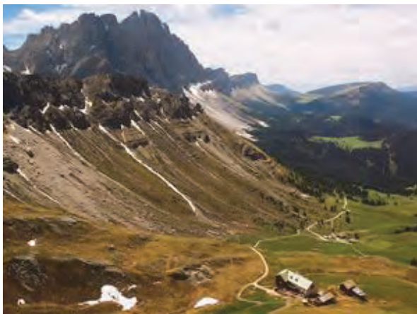
Funes Valle Isarco - Alto Adige