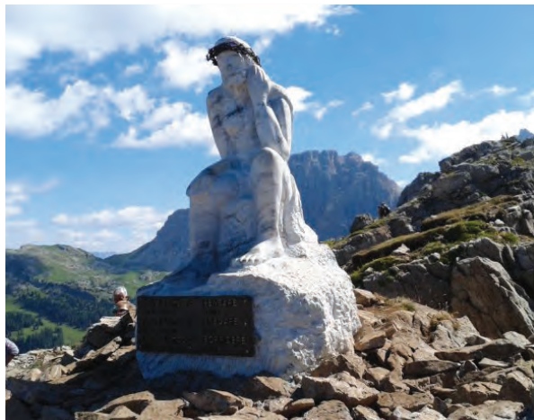
Foto: Passo Rolle - Cristo Pensante