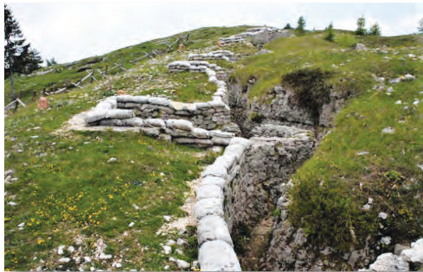
Foto: Monte Zebio - Asiago