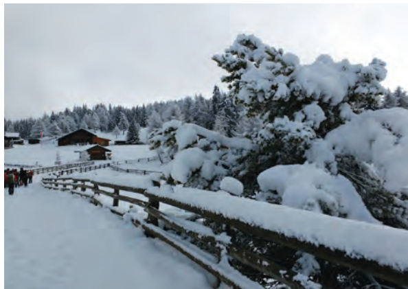
Foto: Rodengo - Rifugio Campoforte