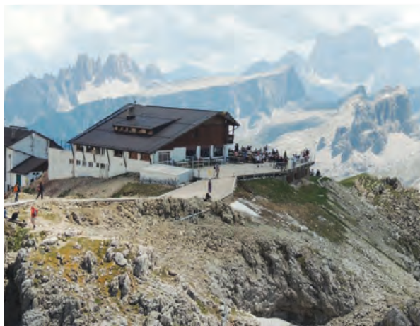
Foto: Passo Falzarego