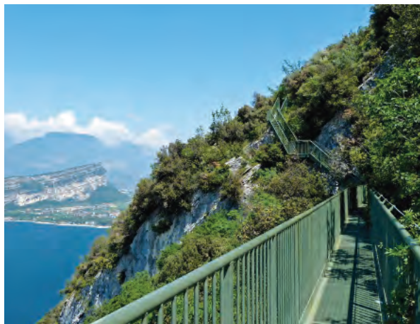
Foto: Lago Garda - Torri del Benaco