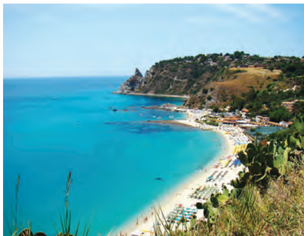
Foto: Calabria - Capo Vaticano