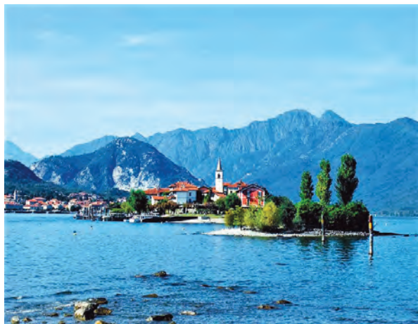
Foto: Isola Pescatori - Lago Maggiore