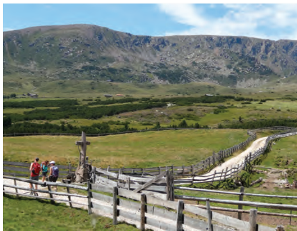
Foto: Alpe Villandro - Rifugio Stoffl